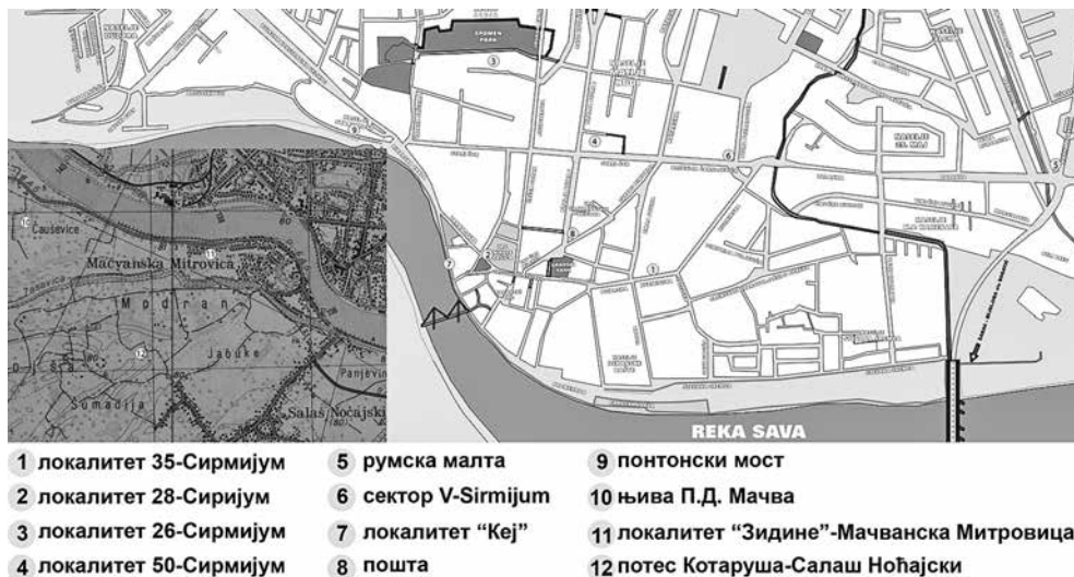
Карта 1 – Положај локалитета са налазима новца Никеје

Налази новца битинијске ковнице Никеје, забележени су на следећим налазиштима у Сремској Митровици или њеној околини: